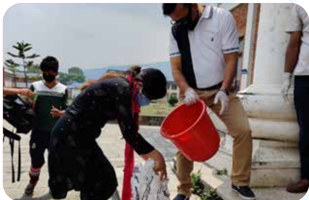
Provided to 800 students of TU, Kripipur