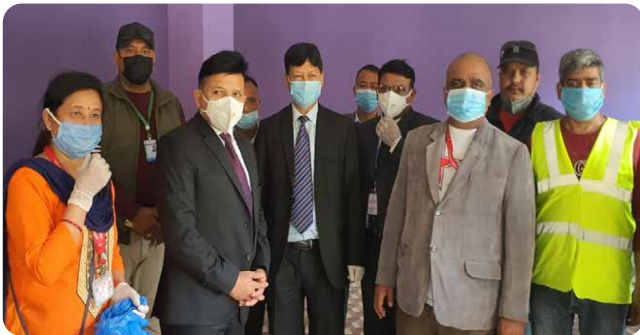
Provided to the Citizens of Ward No. 29, Dilibazar, Kathmandu