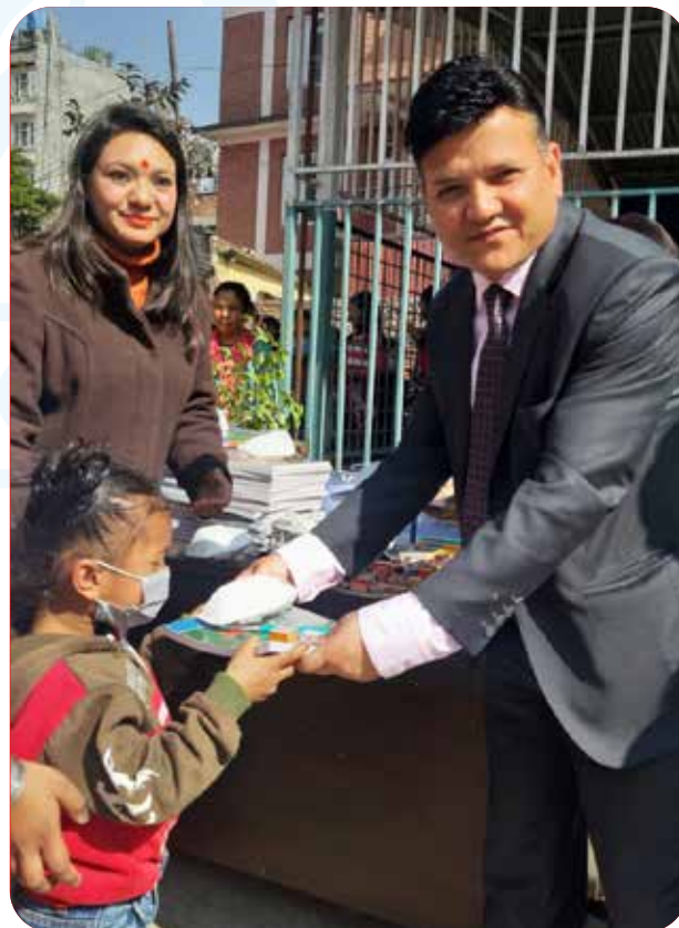
"Educational Material Distribution on the Occasion of Saraswati Puja at Orchid Garden Nepal, Kalopul as a part of CSR."