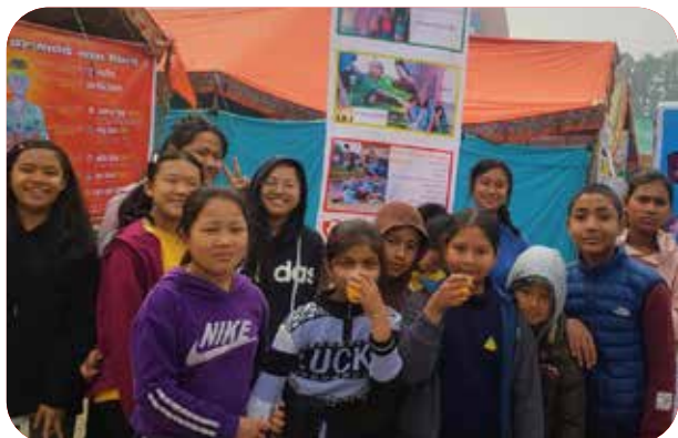
Distribution of water, juice and fruits on the occasion of Mahashivarati at Pashupatinath Temple, Gaushala