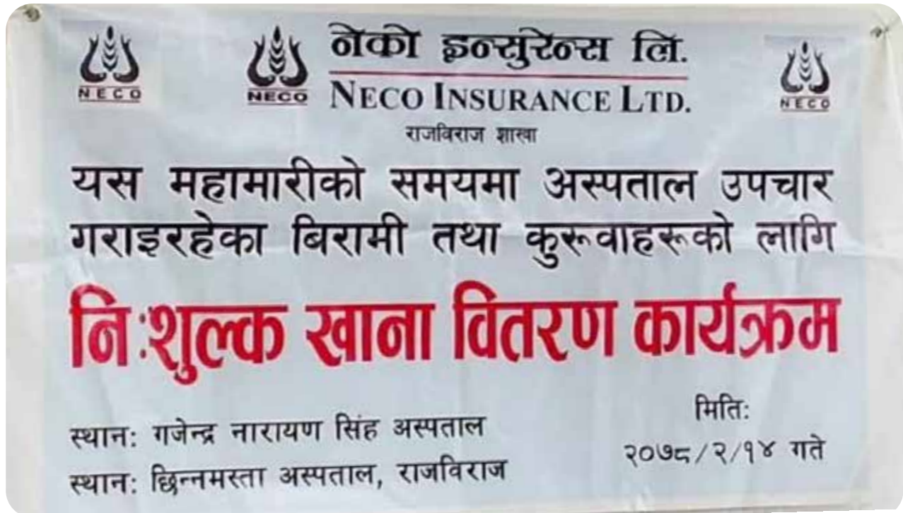
Free Distribution of Food, During Pandemic, Rajbiraj