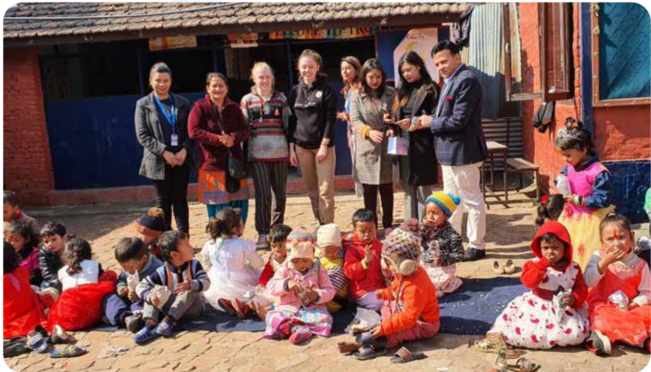
"Educational Material Distribution on the Occasion of Saraswati Puja at Orchid Garden Nepal, Kalopul as a part of CSR."